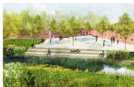
So soll das Wasserbecken im Glacis nach der Neugestaltung aussehen. (Visualisierung: Landschaftsarchitekten Jedamzik + Partner)

>> TOP 2: Gestaltungsvorschlag und Baudurchführungsbeschluss für die Neugestaltung des Wasserbeckens im Glacis