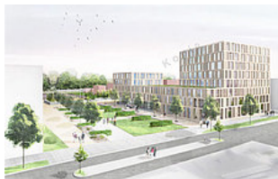
Entwurf Wohn- und Geschäftsgebäude Caponniere 4 (Architekturbüro Braunger Wörtz)