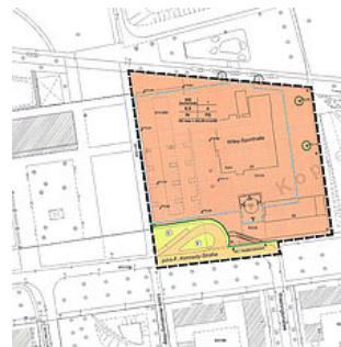
Bebauungsplan M 92.2 Wiley Mitte, Erweiterung Hochschule (Stand 25.3.2015)

Mit dem Satzungsbeschluss des Ausschusses für Stadtentwicklung Umwelt wird der Bebauungsplan M 92.2 „Wiley Mitte, Erweiterung Hochschule“ in der Fassung vom 25. März 2015 nach der Bekanntmachung rechtskräftig.