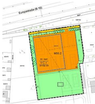
Ausschnitt aus dem Bebauungsplan

Der Runde Tisch war installiert worden, um die seinerzeit vorhandenen Hallenkapazitäten in Neu-Ulm zu organisieren und neue Kapazitäten zu schaffen. Ergebnis der Diskussionen war, dass insgesamt zwei neue Hallen gebaut werden sollen: Zum einen die neue Dreifachturnhalle, die nun im Muthenhölzle entstehen soll, und zum anderen ein neues Turnzentrum für den TSV Pfuhl. Das Turnzentrum hat der TSV in Eigenregie mit finanzieller Unterstützung in Form eines städtischen Zuschusses errichtet.